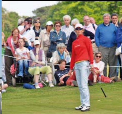
Sophies gute Figur hat einen Grund: Bei jedem perfekt ausgeführten Golfschlag sind 124 Muskeln im Einsatz