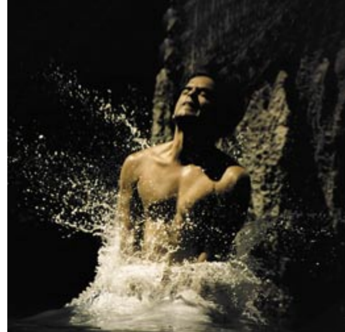
Bei der Eintauch-Phase besteht das größte Verletzungsrisiko

Ich träume davon, mein bisheriges Können mit einer anderen Sportart zu kombinieren. Es klingt etwas abstrakt, aber ich bin auf der Suche nach einer neuartigen Sportkombination. Natürlich halte ich weiterhin Ausschau nach einzigartigen Plätzen zum Klippenspringen – Orte, an denen noch nie jemand zuvor den Absprung gewagt hat.