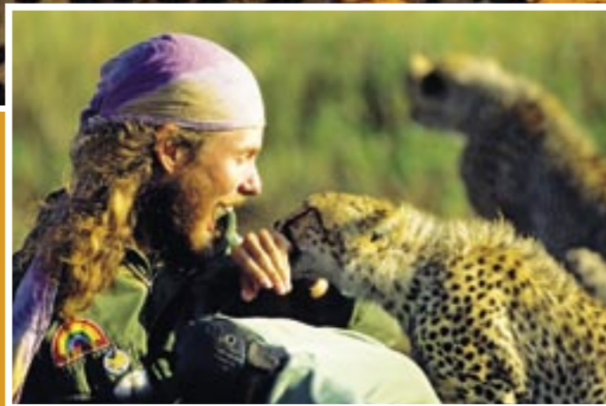
Auf Tuchfühlung mit einem wilden jungen Geparden. Barfuss rät Touri-Tarzan: Auf keinen Fall nachmachen!