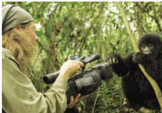
Oft kommen die Gorillas so dicht an die Kamera, dass Barfuss nicht mehr scharf stellen kann