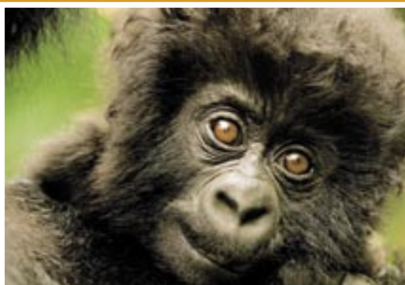
Das Gorillababy Ndeze trauert um seine tote Mama

In ganz Afrika gibt es nur noch 650 Berggorillas! Die Tiere sind akut vom Aussterben bedroht und stehen auf der roten Liste. Matto Barfuss lebte 2005 mehrere Wochen mit verschiedenen Berggorilla-Familien im Grenzgebiet zwischen Kongo, Ruanda und Uganda. Im Dschungel des Virunga-Nationalparks haben die bedrohten Berggorillas ihre letzte Zuflucht gefunden. Doch skrupellose Wilderer haben es auf die Tiere abgesehen. Vor allem die Gorilla-Babys sind auf dem Schwarzmarkt heiß begehrt. Um an sie heranzukommen, werden ihre Mütter getötet – oft sogar die ganze Gorilla-Familie.