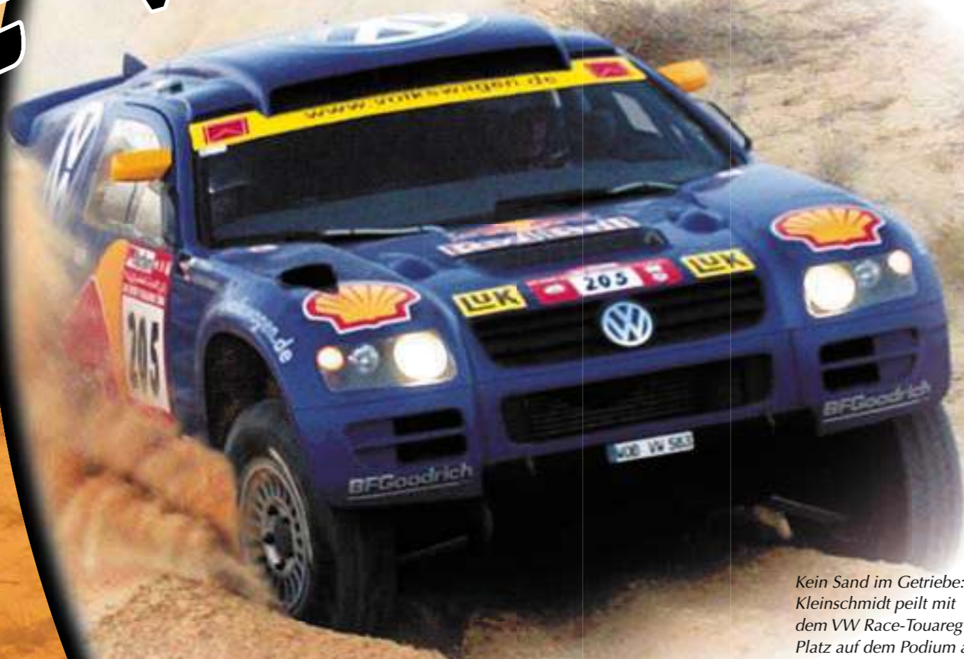
Kein Sand im Getriebe: Jutta Kleinschmidt peilt mit dem VW Race-Touareg einen Platz auf dem Podium an

Gewinn als erste Frau die Rallye Dakar: Jutta Kleinschmidt